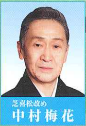
芝翫改め 中村梅花