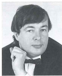
オレグ・ポリャンスキー (ピアノ) Oleg Poliansky

1968年キエフ(ウクライナ)に生まれる。キエフ中央音楽学校を経て1986年グネーシン音楽大学に進んだ。1991年より1993年までモスクワ音楽院でS.ドレンスキーに師事する。モントリオール国際音楽コンクール(1988年)第3位、第11回チャイコフスキー国際コンクール(1998年)第6位等数多くの国際コンクールで入賞を果たす。ケルン音楽大学で教鞭をとった後、現在はロシア、ウクライナ、ドイツ、イタリア、アメリカ、オーストラリア等世界中で演奏活動を行っている。