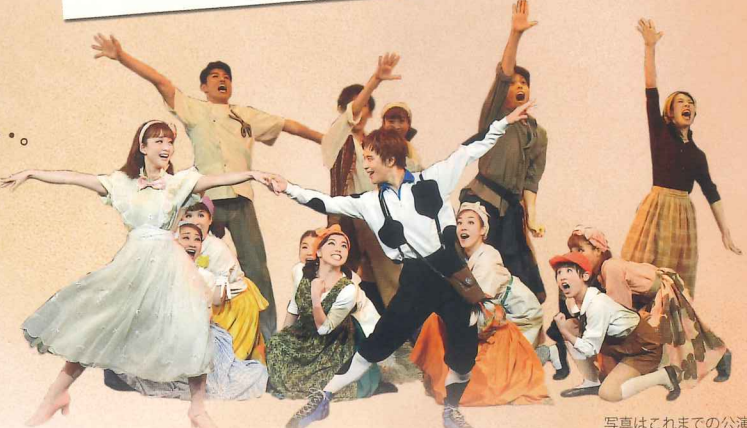
写真はこれまでの公演より

「魔法のように魅惑的!」・・・それは原作者ロイド・アリグザンダー氏がこの作品を観て言った言葉です。作者をも虜にしてしまうその魅力とは・・・。愛すべき登場人物たちが繰り広げる、躍動感いっぱいのダンス。心に訴えかける歌の数々。そしてここが舞台だということを忘れさせてしまうリアルでダイナミックなセット・・・。 それらがすべて物語の力をしっかりと引き立て、人間の素晴らしさ、命や仲間の大切さを伝えてくれるのです。観終わったとき、皆さんの心には、明るく生きていこうという思いがあふれてくるでしょう。ダンスタンの森とブライトフォードの町ではじまる、夢と感動の物語。さあ、あなたもライオネルと一緒に、新しい世界で冒険してみましょう！