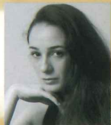
ニノ・サマダシヴィリ