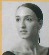
マリyam・エロシヴィリ