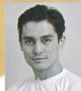
ダレル・ザバロフ