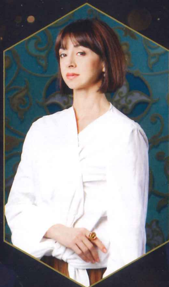
芸術監督： ニーナ・アナニアシヴィリ

伝説のプリマ、 ニーナ・アナニアシヴィリが 20年の時をかけた育んだバレエ団。 充実期を迎えた今 ついに12年ぶりの再来日！