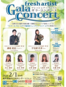
昨年度の公演から ※今年度は2027年2月7日 サブホール開催予定